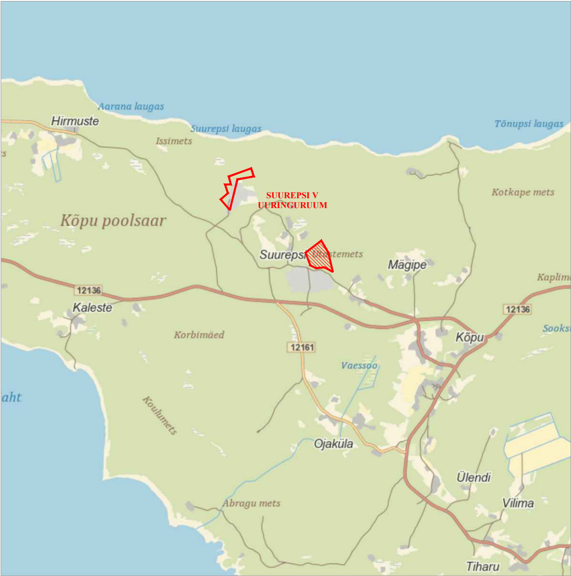
SUUREPSI V UURINGURUUMI ASUKOHAASKEEM mõõtkava 1:50 000 Eesti baaskaardi leht 6124