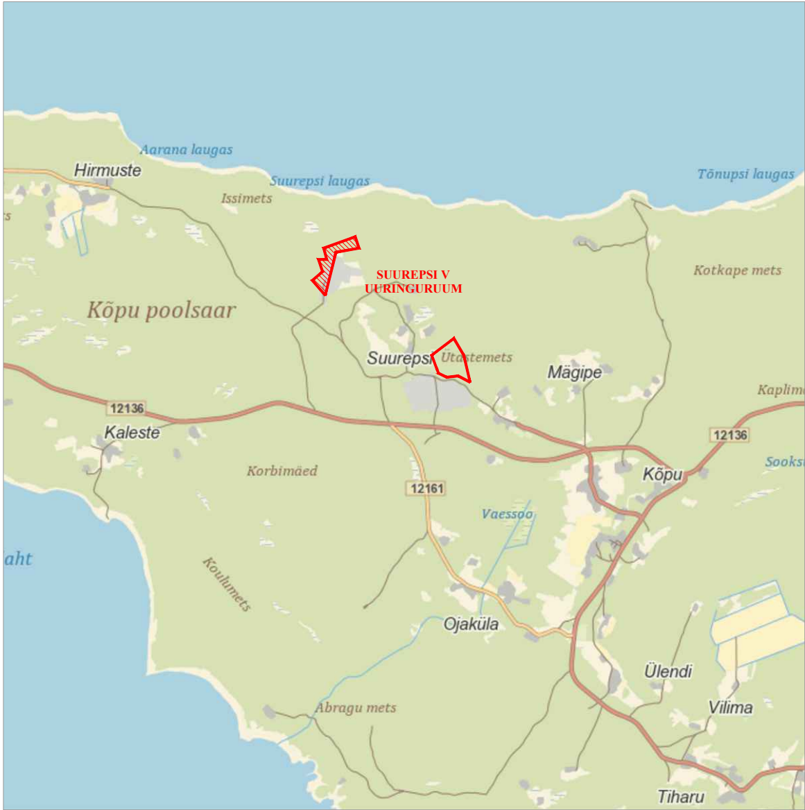
SUUREPSI V UURINGURUUMI ASUKOHAASKEEM mõõtkava 1:50 000 Eesti baaskaardi leht 6124